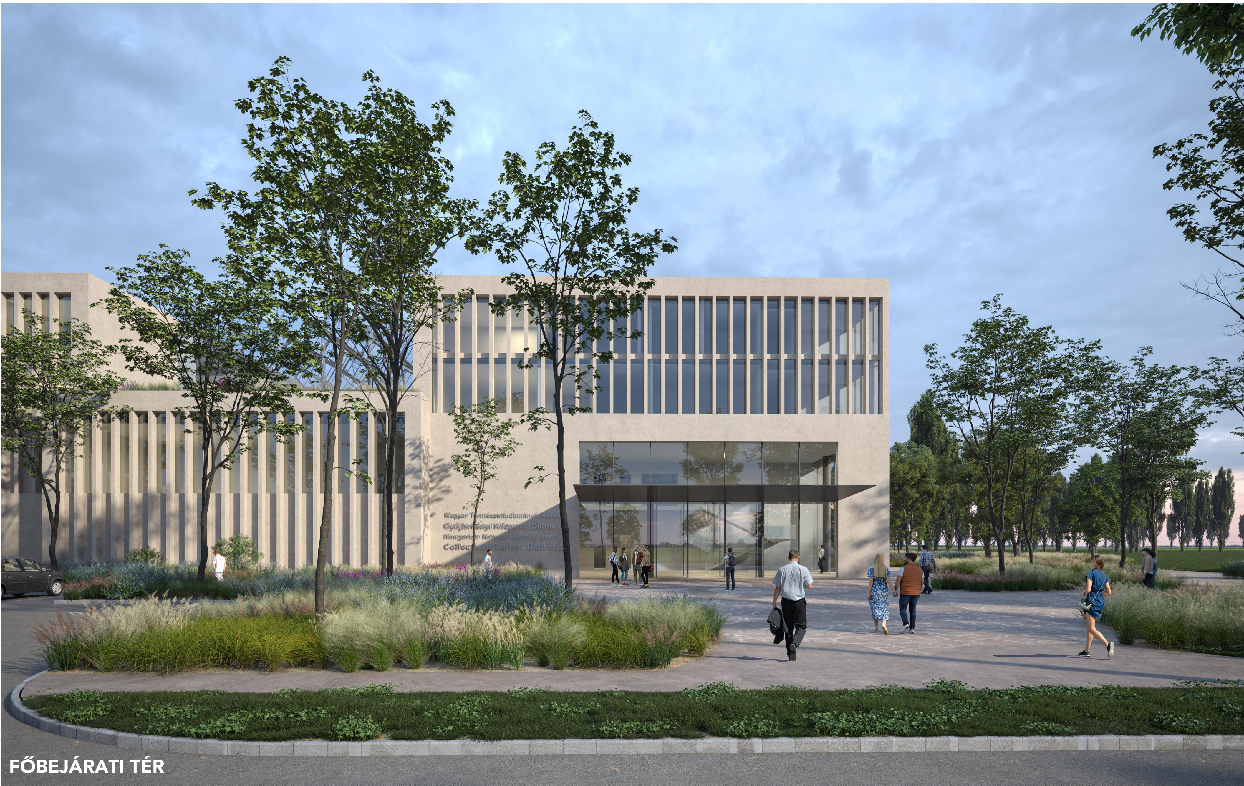
Gyűjteményi Központ A Magyar Természettudományi Múzeum új, debreceni Gyűjteményi Központja - építészeti tervpályázat